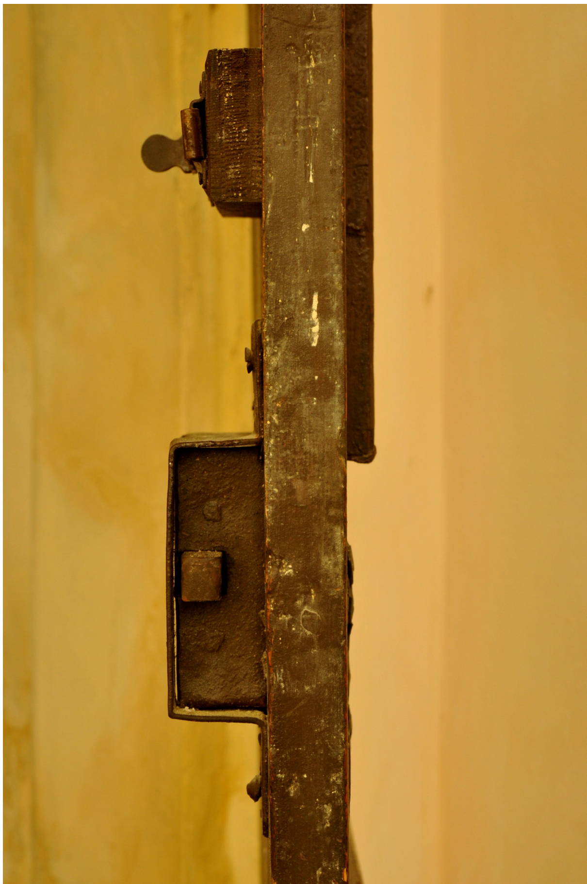
Boční pohled na zámek se zástrčí.