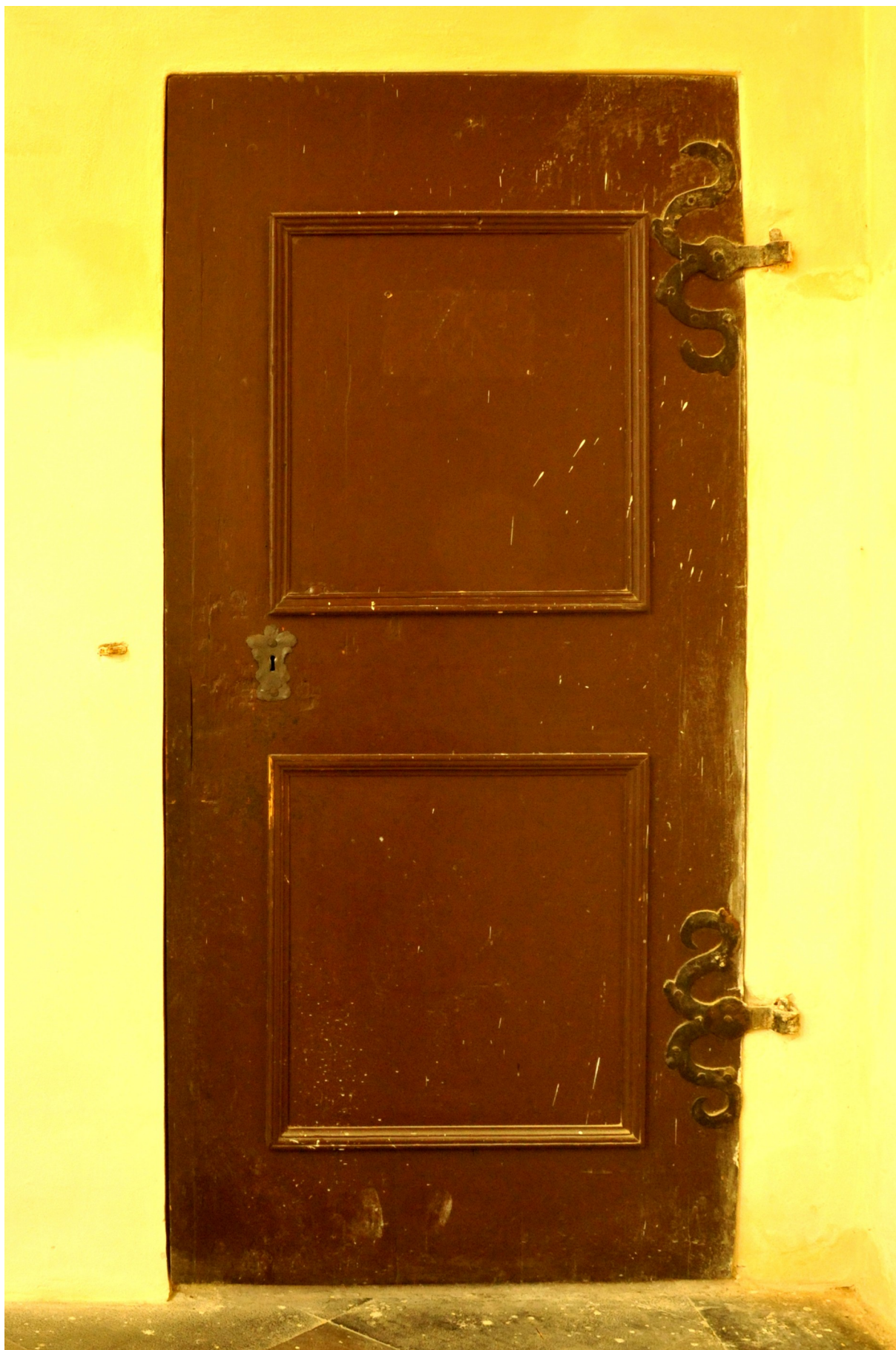
Křídlo je poměrně celistvé. Spárovka byla již v minulosti nastavována masivní lištou. Rovněž druhotné mohou být i lišty tvořící pomyslné orámování výplní.