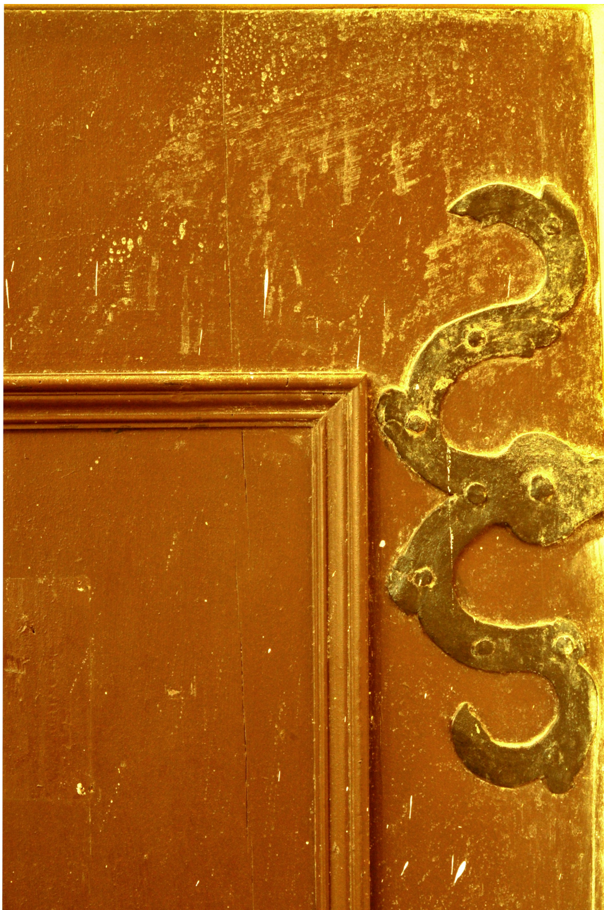
U závěsů se dochovaly původní nýty i hřeby. Spoje, jakož i masiv spárovky rovněž rozpraskán, což pokud to nevadí konstrukci se dá přiznat.