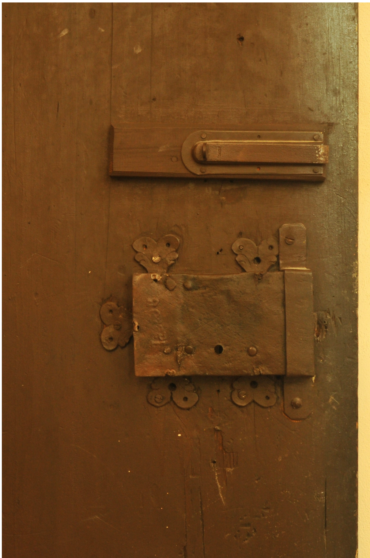
Zámek již nemá původní nýty a hřeby byly nahrazeny vruty. Rovněž třmen je druhotný a působí rušivě, jakož i novodobá zástrč.