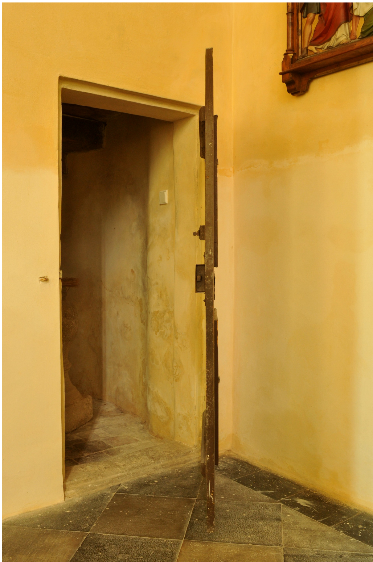
Samotné křídlo je přes svou subtilnost a konstrukci bez větších deformací. V ostění je železné oko pro petlici, která se nedochovala.