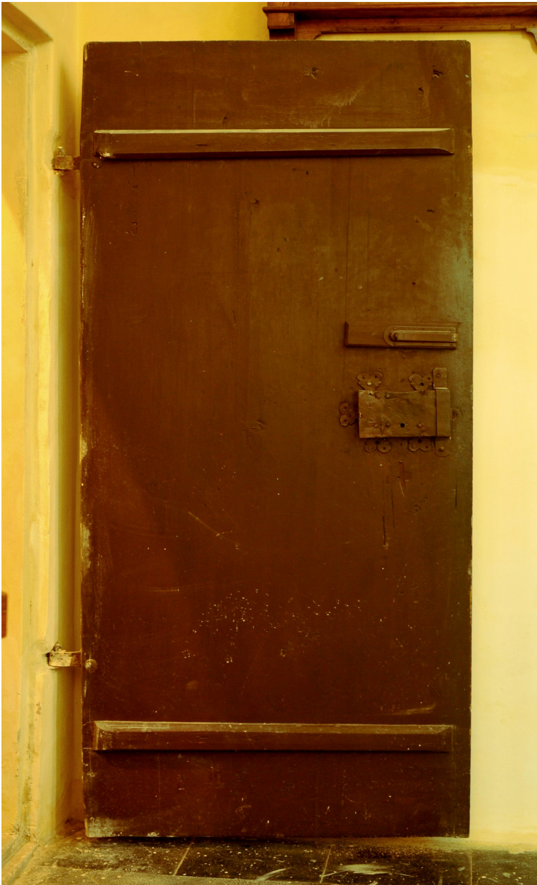
Rubová strana je osazena dvěma svlaky. Krabicový zámek po rozšíření křídla byl překován a osazen jednoduchým třmenem z pásoviny.