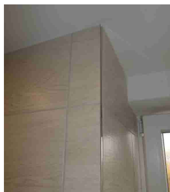
KERAM.OBKŁAD S UKONČUJÍCÍ LIŠTOU