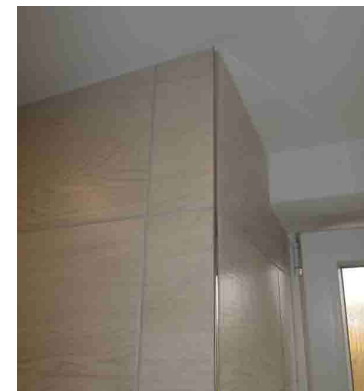
KERAM.OBKŁAD S UKONČUJÍCÍ LIŠTOU